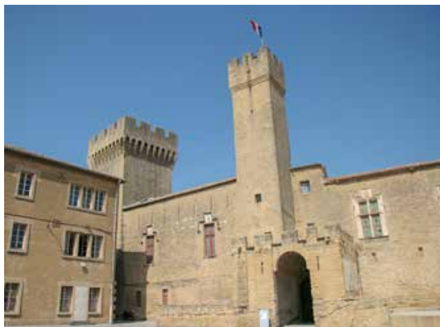
Chateau de l'Emperi kastély

nyelmes, modern autóbusszal történő oda- és visszautat, valamint hét éjszakára a szállodai költséget tartalmazza, reggelivel. Nincs benne az ebéd és a vacsora (ezekről – saját igényei szerint – mindenkinek magának kell gondoskodnia), és nincsenek benne a múzeumi és egyéb belépődíjak, vagy pl. a marseille-i hajókirándulás. A részvételi díjat havi részletekben is be lehet fizetni, ez a jelentkezés időpontjától függően december-január-február-március-április hónapokban havi 42 000 forint átutalását jelenti Szentendre Nemzetközi Kapcsolatainak Egyesülete bankszámlájára.