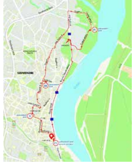
Egyedülálló és példaértékű a belvárosi kardiotanösvény

A rögzített pulzusadatok a Szentendre Applikáción keresztül digitálisan vagy a papír alapú túralapot az indító táblán elhelyezett postaládába dobva az EFI közvetítésével jutnak el a szentendrei rendelőintézet szakorvosaihoz. De jó minőségben