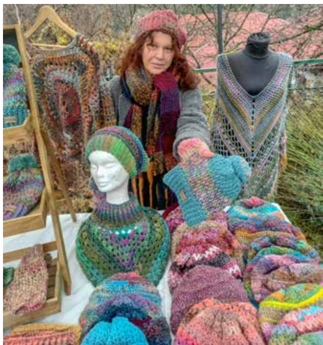
Pete Klára puha, horgolt, színes ruhái nemcsak télen népszerűek

mert nem méretfüggő, kis színfolt, amit bárki szívesen felvesz. A kendő is jó, mert puha, meleg érzést sugall. Lesz külön moher csipkekendő, ez is természetes anyag moherkecske szőrből készült fonalból. S az idei újdonságok a legexkluzívabb termékek, a csipkepulcsi és a horgolt párnahuzat. „Sokkal többfélélt tudok bevinni a repertoárba télen, nyáron viszont a pamut dolgok mennek. Most télen is lesz a kínálatban pamutpulcsi, ami elsőre meglepő, de ezt is viszik, például fesztivál belépő mellé jó ajándék. Ajándékba nemcsak egy évszakra vásárolunk”.