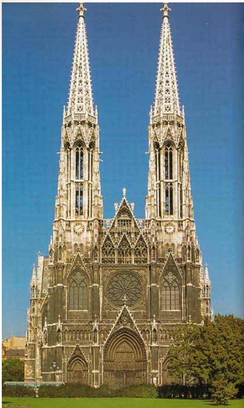
A bécsi Votivkirche, vagyis Fogadalmi Templom