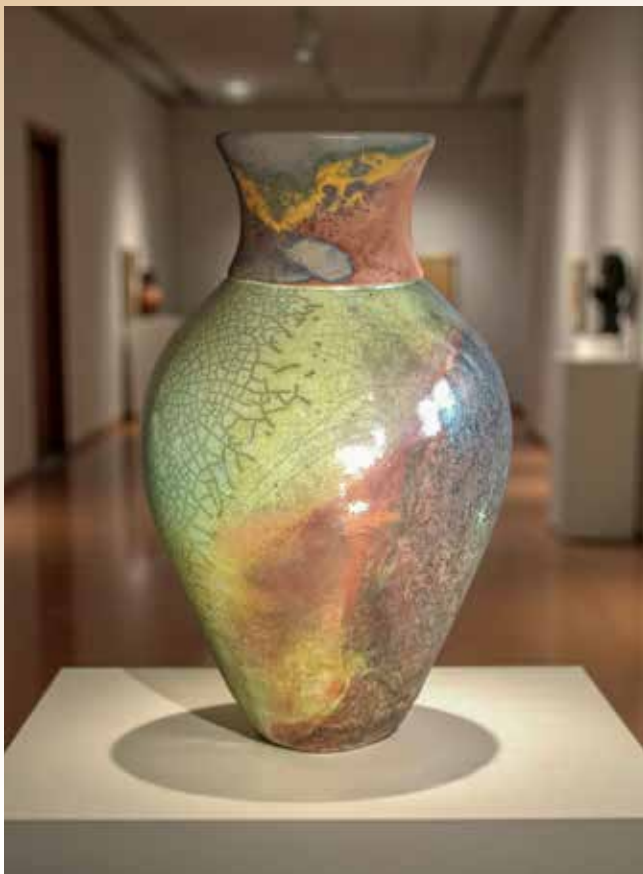
Szentendrén és Kecskeméten is volt önálló kiállítása

állást az Interkerám nevű kerámiaalapanyag-ellátóban. Fájó szívvel hagytam ott a Zeneakadémiát, de nagyon hívott ez az út. És itt egyszerre volt lehetőségem megismerni rengeteg anyagot és rengeteg keramikust, akik egytől egyig rendkívül kedves és izgalmas emberek. Ezután átmeneti bérkorongozást követően belevágtam a saját vállalkozásomba, és nagyjából négy éve most már ebből élek, s úgy érzem, igazán megérkeztem. Persze folyamatosan vannak azóta is hullámhegyek és hullámvölgyek – fejezi be karrierje rövid történetét.