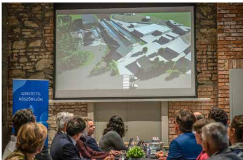
A végállomás új látványtervét a találkozón mutatták be a városvezetésnek

utca és a Pannónia telep családi házas övezetére kért zajvédő falakat viszont megépítik. Az új tervek véleményezésére négy hete van az önkormányzatnak. A MÁV a felújítással párhuzamosan szerzi be az új HÉV szerelvényeket. A megbeszélésen derült ki, hogy az eddigi tervekkel ellentétben nem növelik meg a jelenleg 110 méteres szerelvények hosszát, viszont