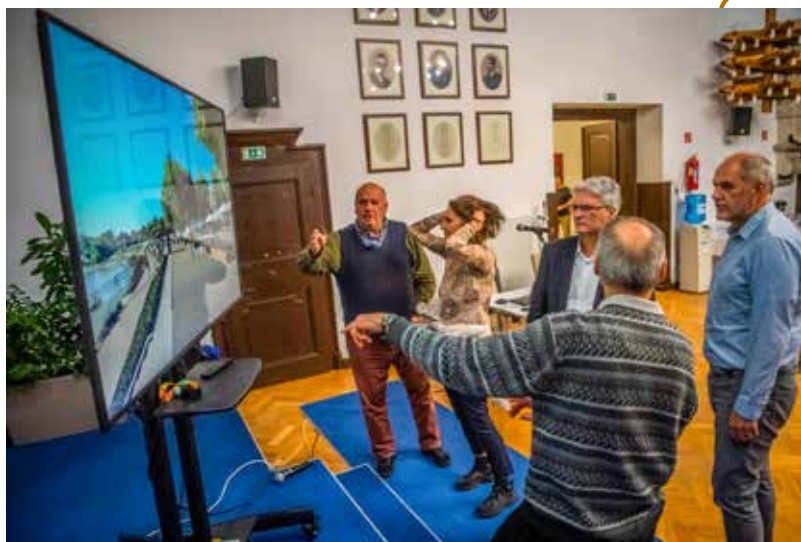
Véleményezték az átdolgozott koncepciótervet a Városházán

sos rézsú felső részén a szélsőséges körülményeket is elviselő, legyökerező szárú, jól újuló, gyomokat elnyomó növényzet telepítését javasolják. A felső rézsúban a leülők hosszát egy szakasszal csökkentették. A fennmaradó zöld rézsúban a fű helyett szintén talajtakaró növényzetet telepítenek. A módosított tervek szerint a felső leülő középső sávja felett napvitorla árnyékolót terveztek. Az árnyékoló a nyári időszakban kerül telepítésre, várhatóan május végétől szeptember elejéig.