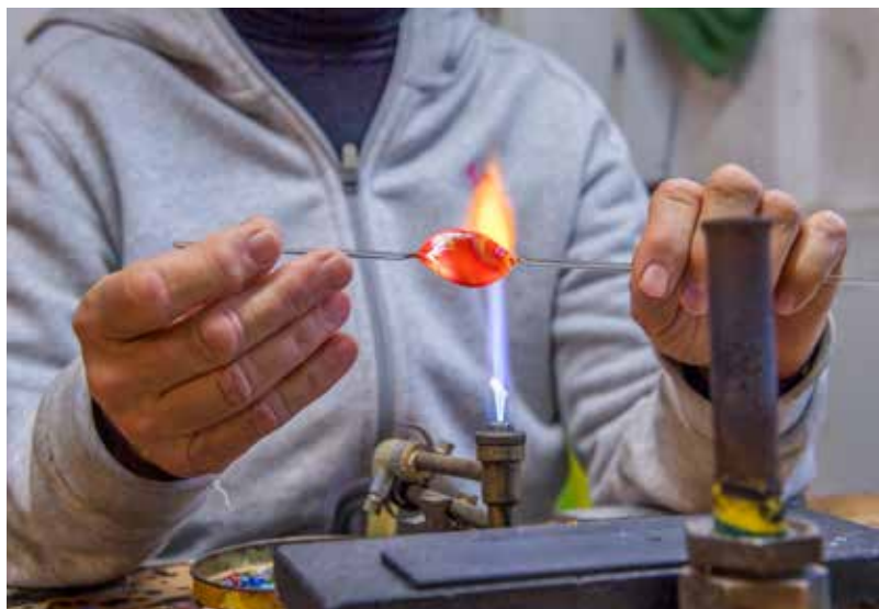
Zágon Judit negyven éve foglalkozik üveggel