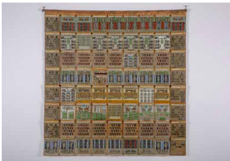
Regős Anna: Computer brokát, 1990 vegyes technika, 126 × 130 cm