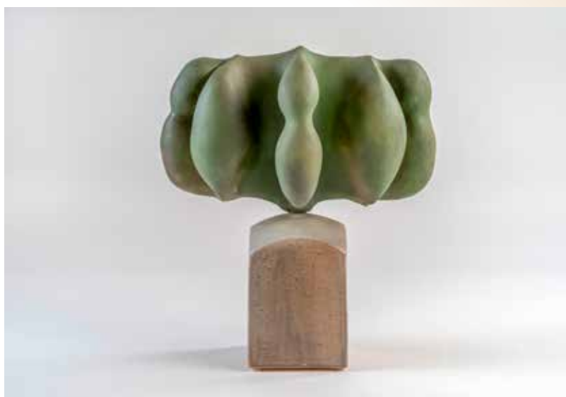
Borsódy László: Organizmus I., 2020 mázás, samott, formázott, homokfúvott térszobrászat, 40 × 20 × 20 cm