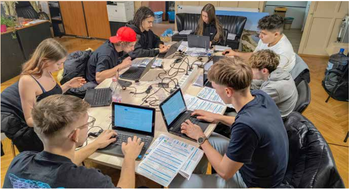
A Petzelttes és Rákóczi diákok gyors munkájának köszönhetően hamar elkészült az első összesítés