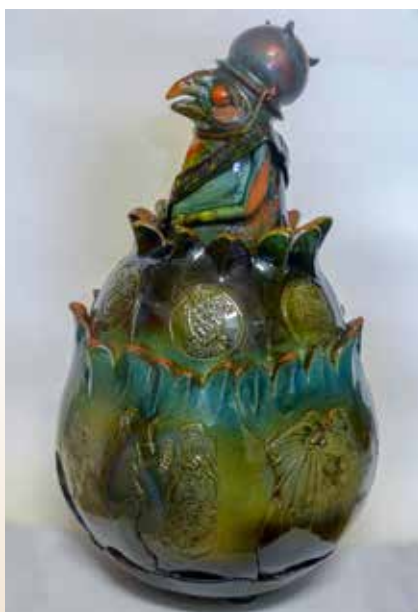
Borsódy Eszter: Ádám virága, 2018 épített, mázas redukált, lüszteres fedeles edény, 45 x 25 cm