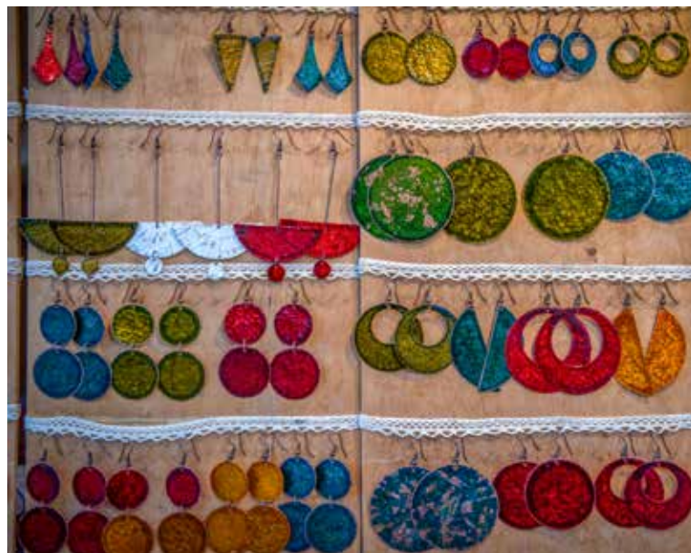
A Sparkle név nem csak a csillogásra és a ragyogásra, de az isteni szikrára is utal

Mostanában az olajzöld és a türkiz a kedvenc színe, ezt választják a vásárlók is. „Tudom, hogy mindegyikre rátalál majd az, akinek rendeltetett, aki idepottyan valahonnan, és az én ékszeremet viszi emlékébe Új-Zélandra, Dél-Amerikába, vagy éppen Ausztráliába Magyarországról.” Egyik indiai vevője videóüzenetben egyeztetett a feleségével; egy spanyol táncos csapat a nagy, piros ékszereket kereste; a japánok körülményesebbek, hajlítgatják, meg is szagolják a színes holmit, és alig hiszik el, hogy a két kezével készítette azokat. Ha pedig valaki neki szeretne ajándékot adni,