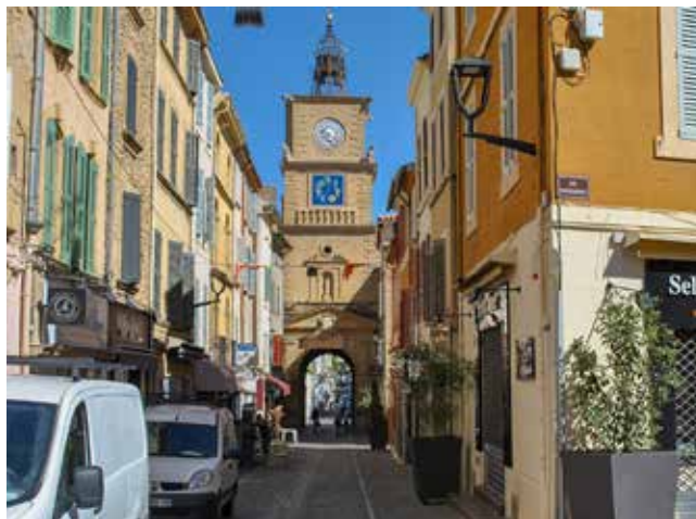
Óratorony Salon de Provence-ban

Várható alapköltség: 210 000 forint, ami a légkondicionált, ké-