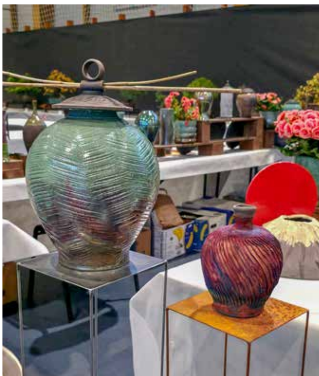
Először néhány bögrét szeretett volna készíteni, ám hivatásváltás lett belőle

Éppen tíz évvel ezelőtt, negyvenegy évesen talált rá a kerámiára, amivel, ahogy mondja, azóta sem eresztik el egymást. Eredeti szakmája irodagép-műszerésztechnikus, de alig egy év munka után, a számítógépek rohamos terjedésével, gyakorlatilag szinte azonnal kénytelen volt új irányt keresni.