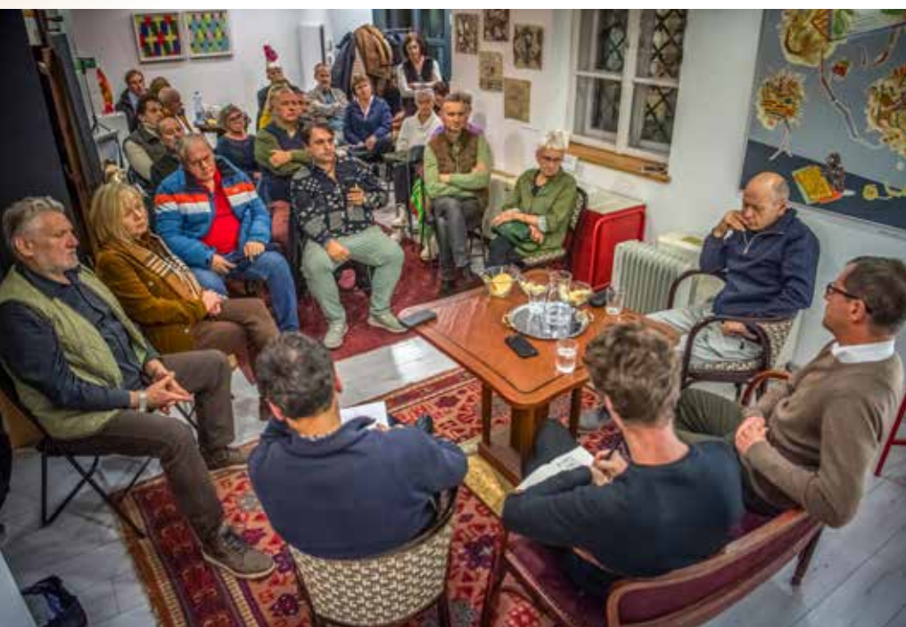
Sok szentendrei művész és művészetkedvelő részt vett a Lakástárlat kerekasztal-beszélgetésén

ben. Ez a két pont sehol máshol nem jöhetett volna létre csak Szentendrén. Emellett számos nagynevű művész élt és alkotott itt, Barcsay Jenő től kezdve Aknay János ig. Valamennyiük életművében Szentendre fontos szerepet töltött be. Vajon ezt az elképzelést mennyire tartjuk ma relevánsnak, mennyire ápoljuk és mennyire tudjuk intézményesen megőrizni?” – tette fel a nyitókérdést.