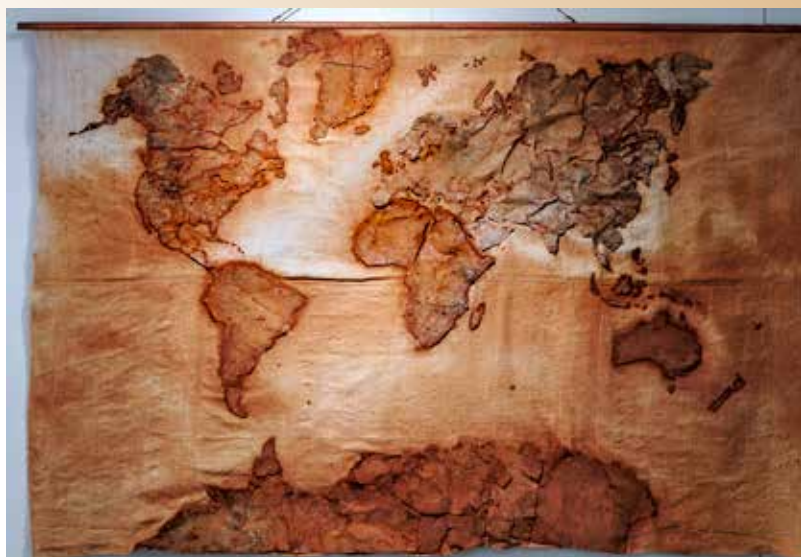
Richter Sára: Világtérkép, 2023 vászon, vashulladék, varrás, áztatás, 130 × 180 cm © MűvészetMalom, A Merkúr pereme, fotó: Richter Sára