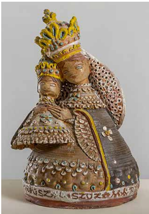
Kovács Margit: Kuglóf-madonna, 1938 Korongolt terrakotta, engobe festéssel és mázzal, bekarcolt díszítéssel, 36 cm (Ferenczy Múzeumi Centrum)