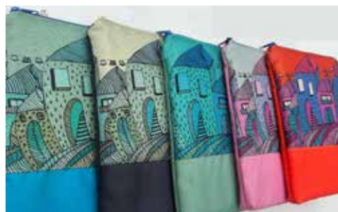
Grafikussal dolgozik együtt, a Szentendre sorozat az egyik legnépszerűbb termék a vásáron

Eddig a kenyeres zsák volt a legnépszerűbb, de az egyedi neszesszerek vagy a keresztbe pántos mobil tokok idén átvehetik ezt a címet. „Személyesebb ajándék is megoldható, ha valaki szerez