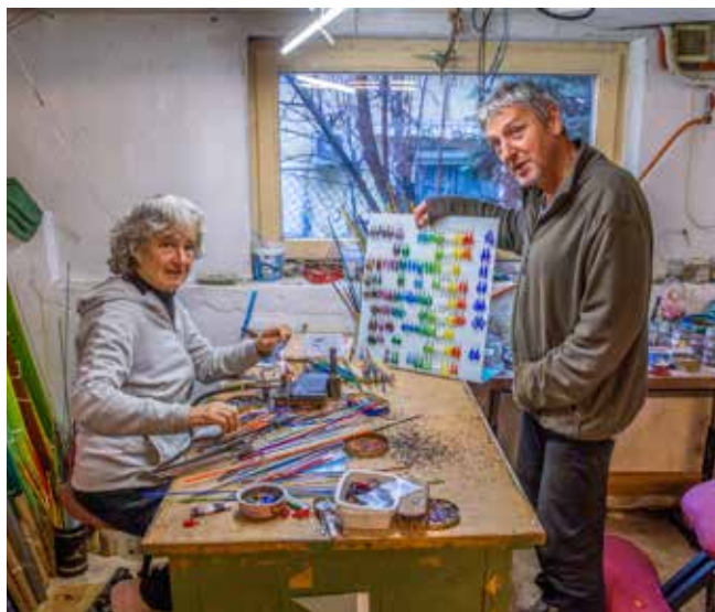
Színek és formák kavalkádja köszönti a számárhegyi stúdióba látogatókat

Negyven éve nyúlt először az üveghez, első férje üvegtechnikus volt, aki otthon is berendezett egy kis műhelyt, amelyet a gyesen lévő fiatalasszony előszeretettel látogatott. Kezdetben szintelen, hajlított üvegekkel kísérletezett. Nem is ment vissza dolgozni,