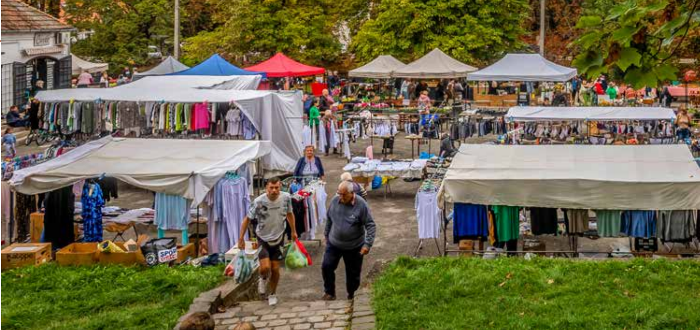
Szerdán és szombaton kínálják terményeiket a helyi termelők a Szentendrei Piacon