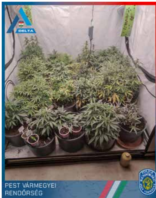
64 tő marihuánát találtak a rendőrök

A terjesztőnél először április 2-án tartották házkutatást, ekkor kisebb mennyiségű, kábítószergyanús növényi törmelék, valamint kristályt foglaltak le. A férfi a nyomozóknak azt mondta, hogy csak saját fogyasztásra tartotta a szereket, bár találtak nála mérleget is. A rendőrség további