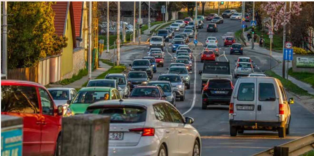
Nagy dugókra számít az önkormányzat a 11-es út felújítása miatt

Amit már régóta vártunk, most valósággá vált: a Magyar Közút tájékoztatása szerint megkezdődik október 10-től a felújítási munka a 11-es főút két szentendrei pontján. Az első fázisban középszigeteket bontanak el a Möller István utcai és Papszigeti úti keresztezéseknél, majd a DMRV kezd vízvezeték- és csatornaépítési munkálatokat a Papszigeti út környékén, a Budapest felé vezető oldalon.