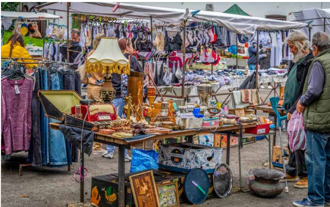
Ha szükségünk van valamire, érdemes a régiségpiacon is körbenézni

És mit teszünk ehhez képest a hétköznapokban? Az ökológusok válasza az, hogy bár jóval tudatosabbak vagyunk, mint néhány évtizeddel ezelőtt, de aki ma Magyarországon él, szinte biztos,