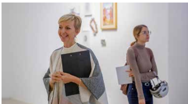
Nagy Luca Múzeumi Mesék programja ingyenesen látogatható október 11-én!