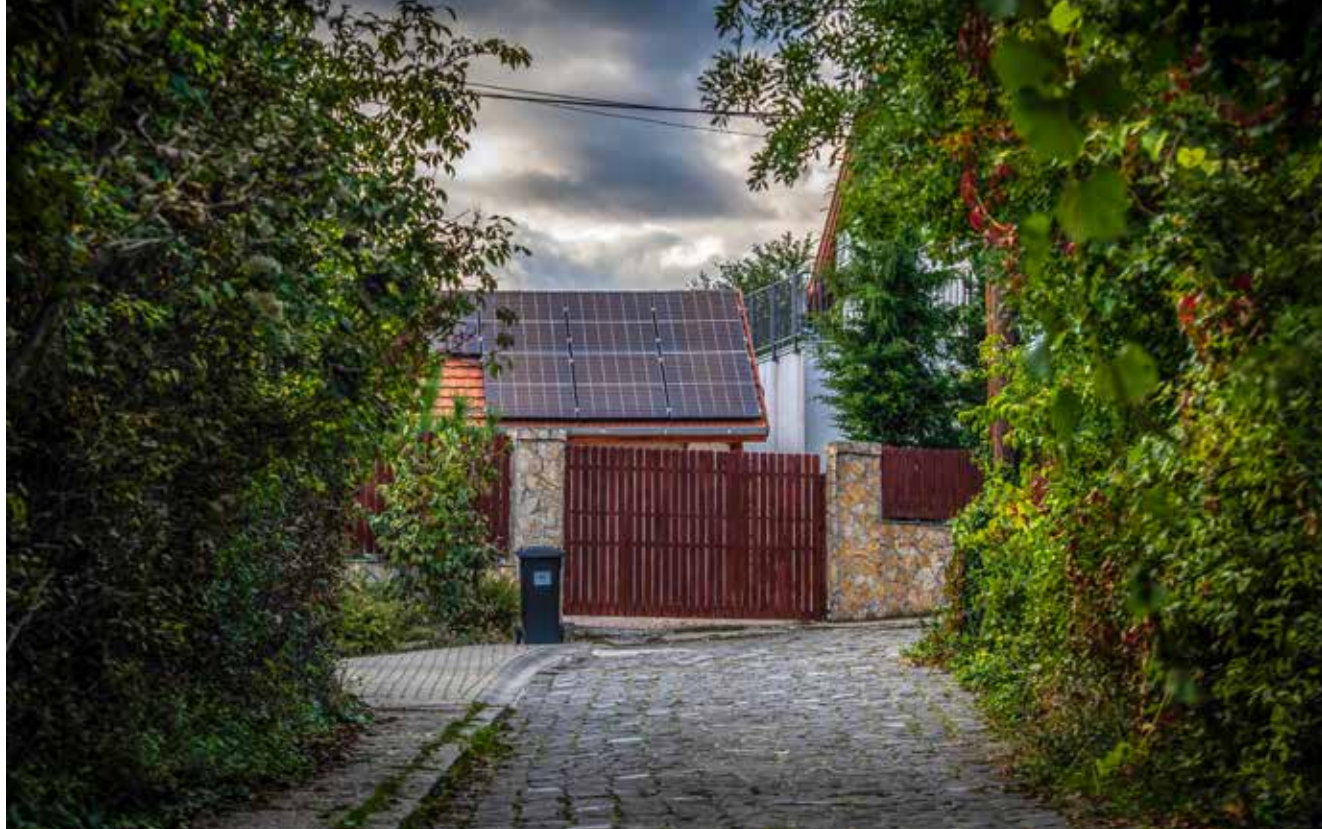
Az energiafogyasztás mérséklése mellett az is fontos, milyen forrásból nyerjük azt

Néhány apró változtatással ráadásul egészen látványosan csökkenthetjük saját ökológiai lábnyomunkat, anélkül, hogy a megszokott kényelmünkben jelentősen le kéne adnunk. A hétköznapiakba apránként beépíthető szemléletváltást angolul 6R-nek mondják: ez a felsorolás könnyen megjegyezhető, és a lényeg benne van. Az első négy a cselekvés szintjét, az utolsó kettő pedig a mindezekhez szükséges gondolati/döntési mintákat sűríti egy-egy kifejezésbe.