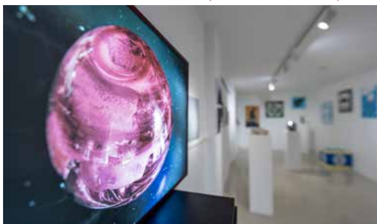
A Merkúr pereme – szentendrei művészek csoportos kiállítása a MűvészetMalomban