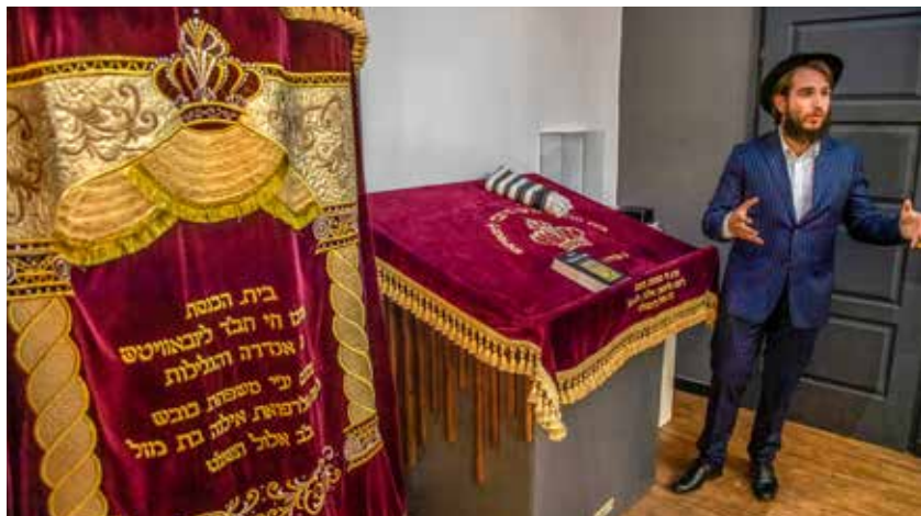
Istenről és a teremtésről szóló zsoltárokat mond a rabbi