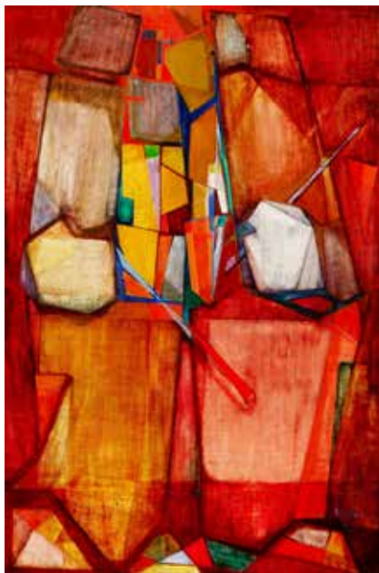
Zenészek, 1950, olaj, fatábla, 220×110 cm, Kálmán Maklár Fine Arts Galéria jóvoltából

A különleges, fénytel teli lazúrtechnikát alkalmazó festményei a háború után színesebbé, nyitottabbá és egyre absztraktabbá váltak. Figurái – harcos anyga-