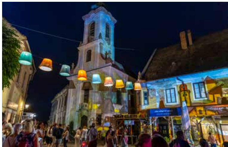
Szentendrei művészek alkotásait vetítették a Főter épületeire

A Barcsay Múzeumban egész nap immerzív élmény várta a nézőket különleges, mágikus teret teremtve Barcsay Jenő alkotásainak vetítésével, zenével. Itt adott elő naponta háromszor