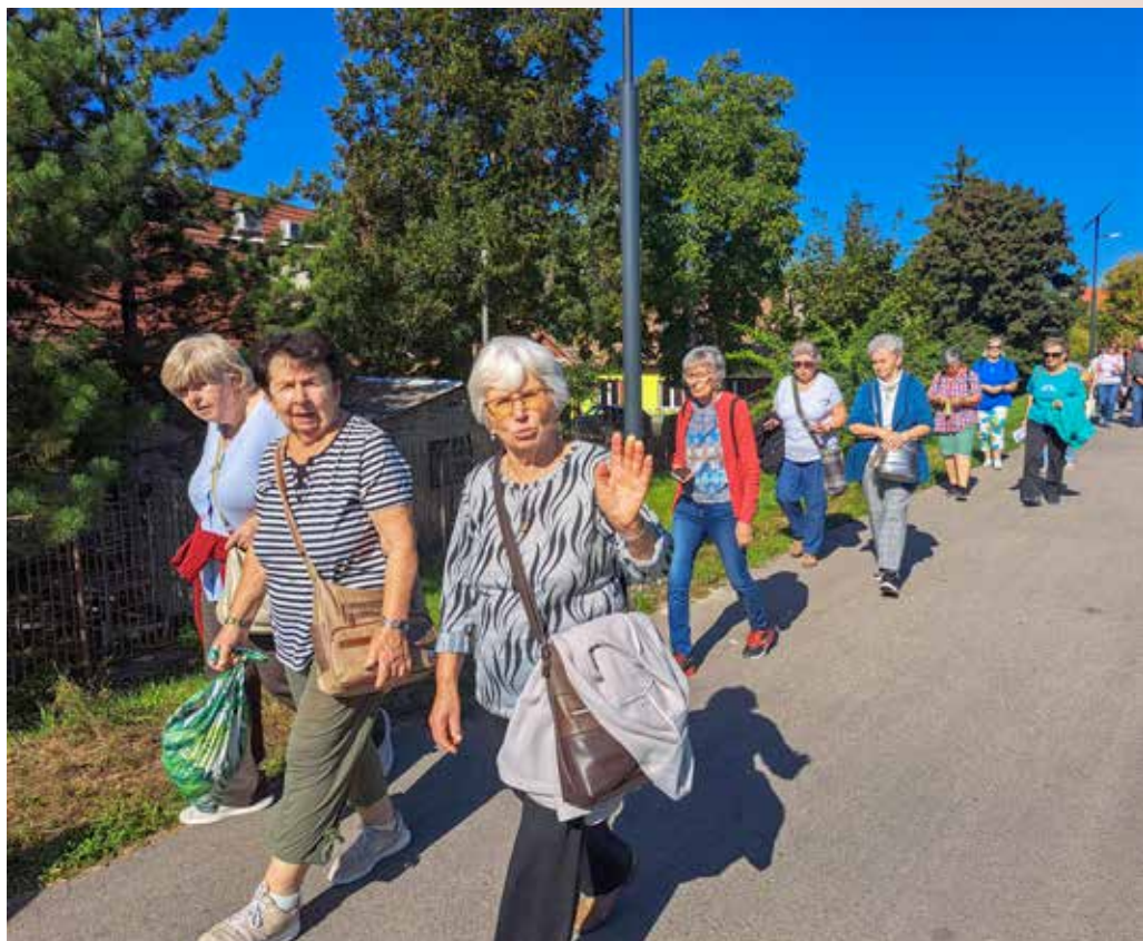
Négy kilométert gyalogoltak a nyugdíjasok

A szerb Kálváriát sajnos csak kívülről tudtuk megtekinteni, majd elindultunk visszafelé, érintve a Trianon-élművet és a szintén utunkba eső, a II. világháború helyi áldozatainak emlékére állított alkotást. A Bükkös-patak tanösvény második állomása a piacnál és a Bükkös-patakot átszelő Apor híd is utunk része volt, a híd kovácsoltvas korlátján elhelyezett,