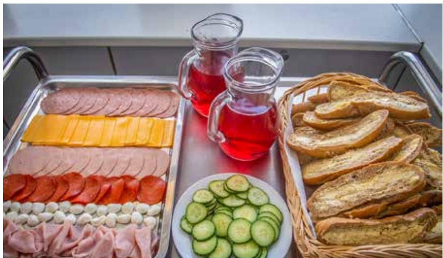
Változatos ételek kerülnek a szentendrei diákok asztalára

szönhetően ebben az irányban is történő lépés a városban. A központi konyhára beszerzett burgonyakoptató (krumplipucoló) és aprító gépek lehetővé tették, hogy az eddig használt vákuumfóliázott, kénnel vagy citromsavval előkezet helyett friss burgonyát használjanak a krumplis ételekhez. Mindez nemcsak az alapanyag