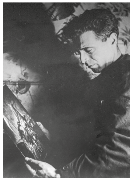
Szóbel Géza portréja, 1940 körül

Szóbel Géza festőművész életének és művészeti hagyatékának sorsa halála után a második École de Paris sok emigráns művészehez hasonlóan szinte a teljes feledés homályába merült. Művei már az 1970-es években szétszóródtak, munkássága a művészettörténet figyelmének látókörén teljesen kívül esett. Szóbel mint soknemzetiségű alkotó és egész Európát