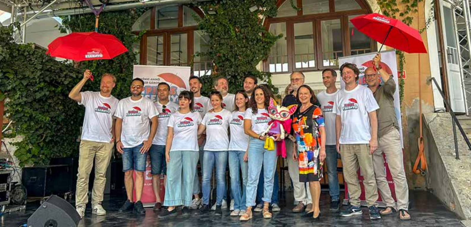
A Kolibri Színház csapata kelti életre "A piros esernyő" című meséjátékot