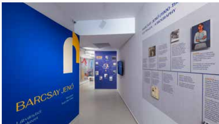
Látványból szerkezet – A táj és a test transzformációi Barcsay Jenő művészetében | Kmetty Múzeum

A programokra jegyek a helyszínen, vagy elővételben a jegymester.hu -n vásárolhatók.