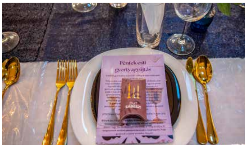
Gyertyagyújtással kezdődött a sábesz