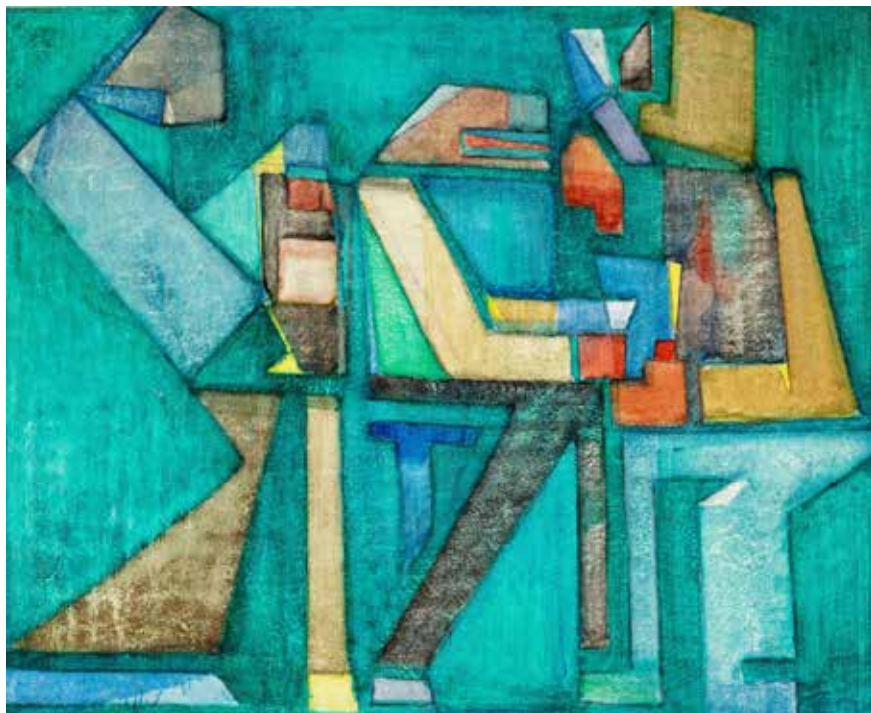
Kártyázók, 1950, olaj, fatábla, 78×98 cm, Kálmán Maklár Fine Arts Galéria jóvoltából

A tárlat megtekinthető: 2025. november 9-ig, csütörtöktől vasárnapig 10 és 18 óra között a Ferenczy Múzeumban (Kossuth L. u. 5.).