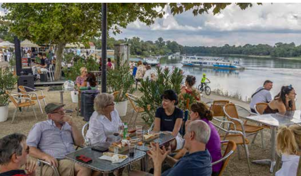
Hajnalgig beszélgettek a kisebb-nagyobb baráti társaságok a Gasztró Korszó Bártban