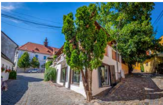
Szentendre belvárosa ma is őrzi az eredeti, XVII. századbeli szerkezetét

A mai Szentendre területére III. Csarnojevic Arszenije pátriárka vezetésével, szintén a törökök elől menekülve, 1690 késő őszen érkeztek az első szerb betelepülők. Ezt az időszakot „nagy szerb vándorlás” néven őrzi a történelem. A különböző régiókból származó csoportok az alakuló új városban belül úgynevezett mahalákban (negyedekben) telepedtek le. Az akkori településszerkezet legnagyobb részét a mai napig megmaradt, ahogy a kanyargós, keskeny utcáiként, és a tipikus szentendreiként ismert utcakép is ebből a korszakból származik. Eredetileg tizenkét mahalát hoztak létre, majd 1724. és 1730. között ez a szám (néhány mahala egyesítésével) hét városrészre csökkent. A mahalák központjában egy-egy templom maradt, melyeket a származási helyükről, vagy a lakosságra jellemző foglalkozásokról neveztek el. Mindezek következtében megtelepedésük után nem sokkal legalább hét