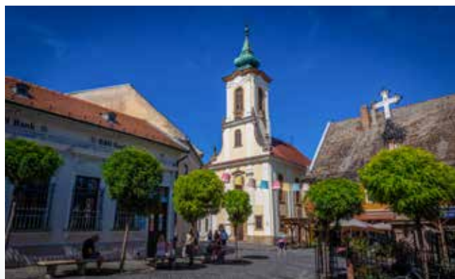
A Blagovestenszka építésénél fontos volt a központi elhelyezkedés