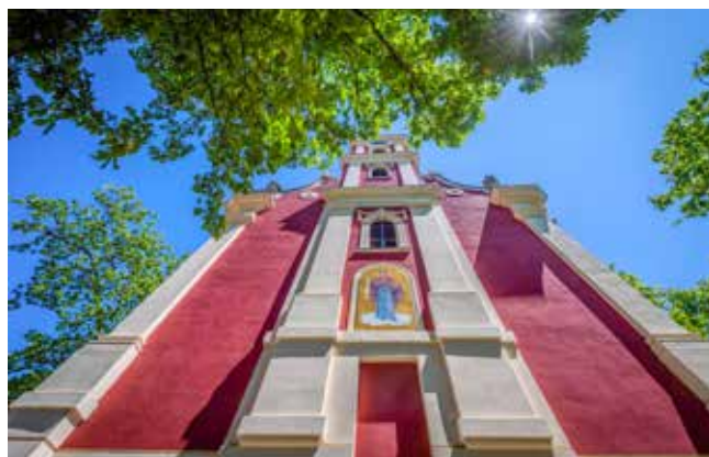
A Belgrád templom eredetileg sokkal kisebb volt

A Székesegyház (ismertebb néven Beográd vagy Belgrád templom), amely eredetileg egy jóval kisebb épület volt, már 1690-ben kőből épült, ezzel is jelezve a püspöki székhely kiemelkedő jelentőségét. Mivel a törökök kiűzése után a budai egyházközség romokban állt, Szentendre – és így a Belgrád-templom is – lett és maradt hosszú ideig az egyház központja. (Az akkori falak nyomát a mai templom padlózata őrzi). Jelenlegi méreteit nagyjából száz évvel később nyerte el. Az újabb építkezés egyik nem titkolt célja