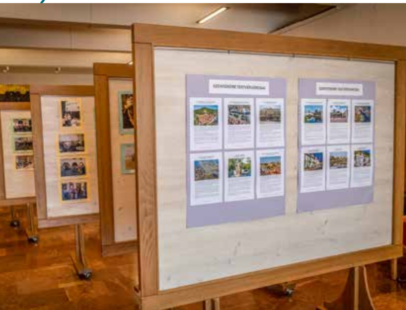
Kiállítás mutatja be a testvérvárosi kapcsolatok elmúlt 25 évét a Hamvas Béla Pest Megyei Könyvtárban

A testvérvárosi kapcsolatok létesítésének gyakorlata a második világháború után vált szélesebb körűvé. A mozgalom fő célja, hogy a nagy háborúk és világégések után elsimuljanak népek közti évszázados ellentétek, közelebb kerüljenek egymáshoz az emberek a személyes barátság révén, elősegítse egymás kultúrájának, gondolkodásának megismerését, jobb megértését és a határokon átívelő projektek létrejöttét.