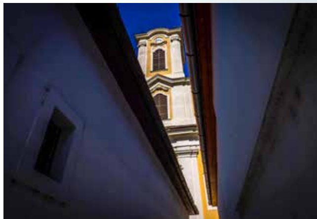
A Csiprovacska ma katolikus templomként működik

A Csiprovacska ma Péter-Pál templom néven katolikus templomként működik, az eredeti fatemplom helyén 1751-ben építették. A katolikus egyház többször felújította, de eredeti, ortodox jegyei