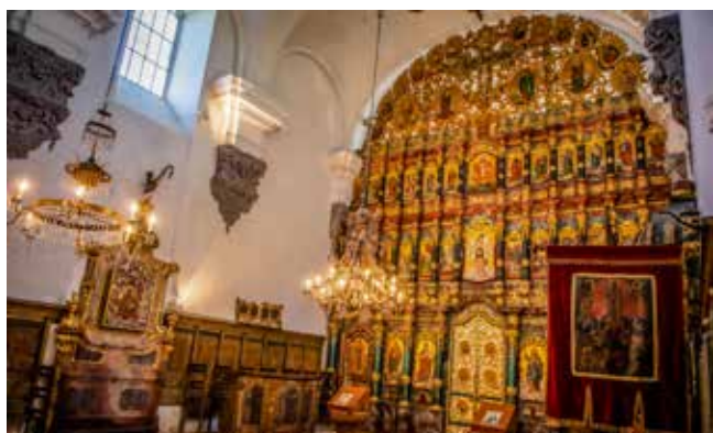
A Preobrazsenszka templom túlélte az 1838-as árvízet, ezért a csodák templomaként emlegetik.

Berendezését a keleti keresztény templomokban megszokott ikonosztázon, képfal uralja, amely több szempontból is érdekes. Ez Szentendre legrégebbi ikonosztáza, amely talán eredetileg a székesegyházba készült, de mivel azt időközben megnövelték, végül ebbe a templomba került. A közelmúlt eseményeihez kapcsolódó érdekes párhuzam fűződik a templom történetéhez: a nagy 1838 márciusi árvíz idején a templomban egy nap alatt két méter magasra emelkedett a víz. A déli főbejárat melletti bevésített vonal és évszám, valamint a szentély külső falán elhelyezett árvíztabla is jelzi az akkori vízszintet.