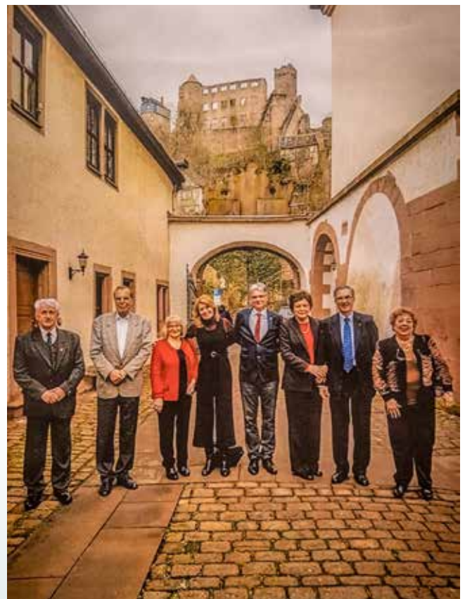
Testvérvárosi megbeszélés 2020-ban Wertheimben