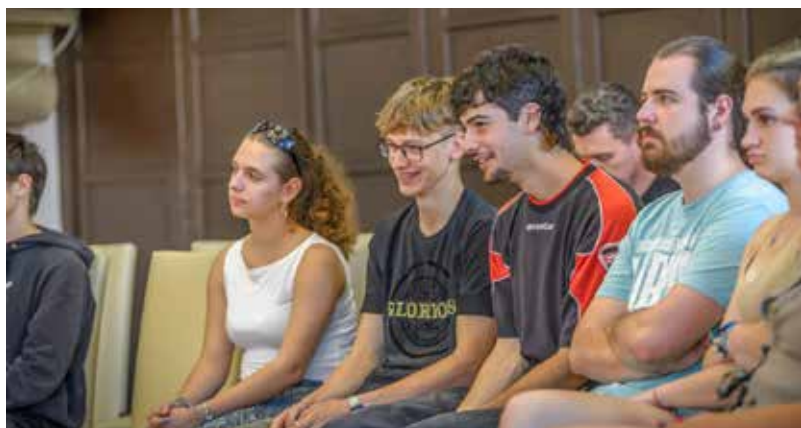
Diákok az ifjúsági Részvételi Költségvetés eredményhirdetésén

A nyertes ötlet, a zenei fesztivál megvalósításával folytatódik a szervező diákok munkája a Szentendrei Kulturális Központ segítségével. A cél: egy valóban fergeteges este, amely maradandó élményt nyújt a város ifjúságának. Tisztázni kell olyan kérdéseket is, mint hogy milyen programok legyenek, milyen zenekarok lépjenek majd fel a diákság estéjén. Ehhez a szervezők várják a javaslatokat, amelyekkel megkereshetők az iskolában, sőt még csatlakozni is lehet résztvevőként a programhoz.