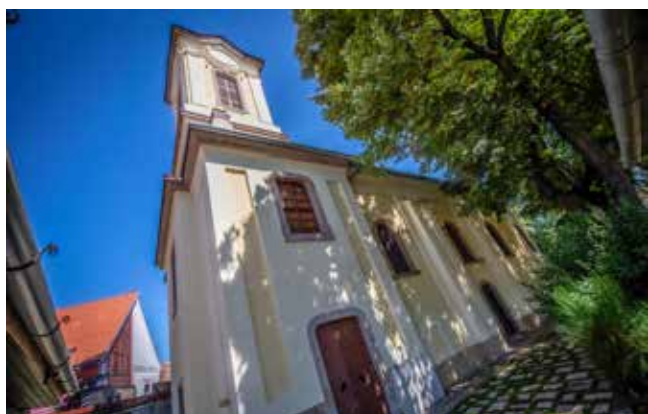
A Pozsarevacsk harangtornyában egy fatáblán olvasható a templom története

A Pozsarevacsk a a belváros bejáratánál, a Bükkös-patak partján áll, Pozsarevac környékéről érkezett betelepülők építették Szent Mihály arkangyal tiszteletére. Az eredeti fatemplom helyén 1760 körül épült fel a mai kőtemplom. Különlegessége, hogy harangtornyának aljában függ egy 1845-ben készült fatábla, amely összefoglalja a templom történetét. A szerb ortodox egyház november 21-én üli Szent Mihály ünnepét, jó ideje ez az egyetlen alkalom az évben, amikor itt Szent Liturgiát végeznek.