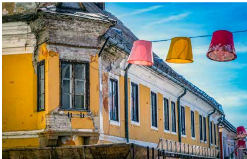
A Kereskedőház tetejének felújítását legkésőbb 2026-ban meg kell kezdeni

üzent nekünk az épület, legutóbb az emeleti födém beszakadásakor” – hívja fel a figyelmet az alpolgármester. A városvezetés szándékai szerint legkésőbb 2026-ban neki kell látni a tető és a tetőszerkezet teljes felújításának. A tetőszerkezet megerősítése, megújítása a központi költségvetésben nem jelentős tétel, vagyis csak szándék kérdése, hogy a város soron kívül végre megkapja a szükséges támogatást a kormánytól.