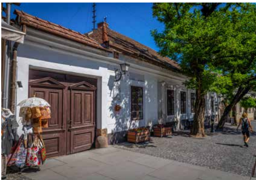
A városvezetés tervezi a Barcsay Múzeum felújítását