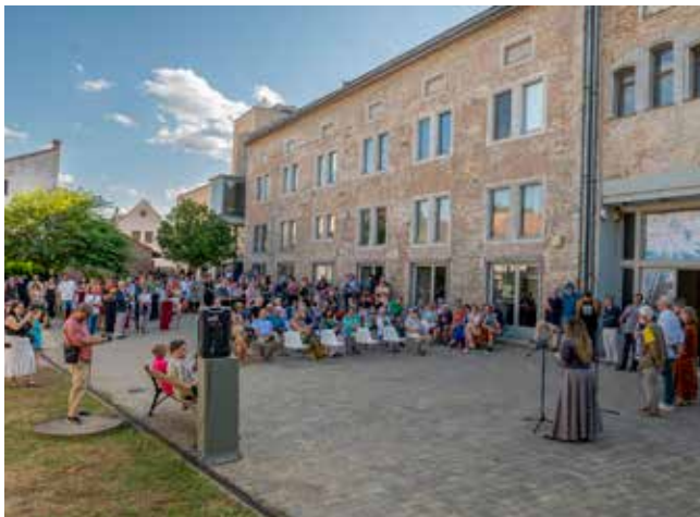
Rengetegen eljöttek a megnyitóra

A megismerni kívánt külső világ és az emberi mérték kettőssége összegződik a jelen kiállítás Merkúr-értelmezésében. A dimenzióváltások, az eltérő léptékek a legváltozatosabb műalkotásokon és műfajokon – festményeken, szobrokon, fotókon, hang- és videóinstallációkon – keresztül jelennek meg. E különös kontextusban a művész szerepe, zsenialitása, beavatottsága, értelmi és spirituális ereje is felértékelődik. A kiállítás egyik kuriózuma az Egyesült Államokból érkezett. Lois Viktor több mint harminc év tapasztalatát összegző, After Nirvana című legújabb hangszer-szoborra most először látható Magyarországon.