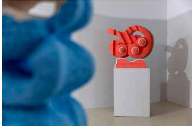
A Merkúr pereme

A kereskedők, utazók patrónusaként ismert görög-római istenhez kapcsolódik minden olyan tevékenység, amelyhez leleményesség, ötletesség, jó rábeszélőkészség kell. Apollón lantját is Hermész készítette: egy teknősbéka üres páncéljába feszítette a pendíthető húrokat. Mitológiai történetéből a későbbi századok is sokat merítettek, számos kereskedelmi cég és termék, krea-