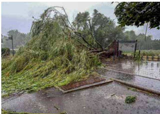
Kidőlt a fűzfa a Bükkös-hídnál