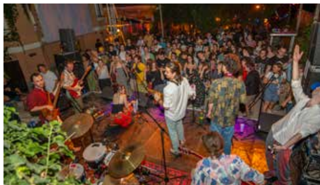
Koncert a fesztivál utolsó napján

Ezen három nap alatt a fenti helyszíneken együtt mutatkoztak be művészeti egyetemisták – SZFE, FreeSZFE, MOME, Képző – és más alkotók, fittyet hányva kulturális székfoglalókat és ideológiákra. Koncertek, színházi előadások, performanszok, filmvetítések, kiállítások, workshopok, tematikus beszélgetések zajlottak a város négy pontján. Minden programra sokan voltak kíváncsiak, az esti koncertek teljes telt házzal mentek. Az intellek-