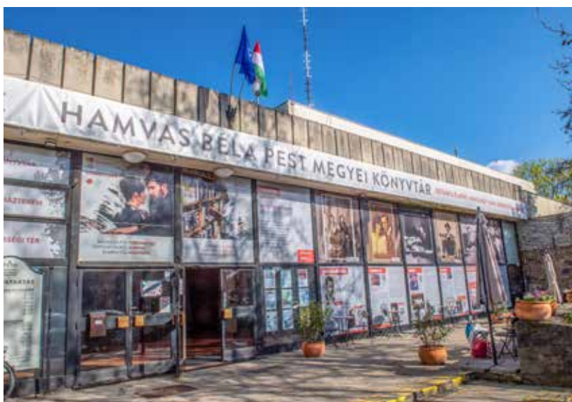
Időszerű a könyvtár megújulása, a város elindította a tervezési folyamatot

re már felújításra szoruló és részben elavult épület megújítását, bővítését. A jogtulajdonos Középülettervező (Köztí) el is készítette akkor az előzetes tervek. 2006 után azonban a megyei önkormányzat nem folytatta a könyvtár megújításának programját. A szentendrei városvezetés, immár az ingatlan tulajdonosaként, 2021-ben újra felvette a kapcsolatot a Köztível