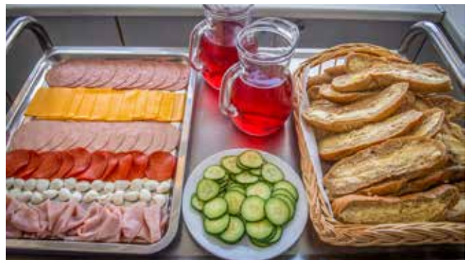
Svédasztalos reggeli a Szivárvány úti tagóvodában

A sikeres Menza program bevezetése után a Városi Szolgáltató folyamatosan vizsgálja annak lehetőségét, miként vezethet be további újításokat a közétkeztetés színvonalának továbbfejlesztésére, ezért felmérte, hogyan tudná még változatosabbá, még színesebbé tenni a szolgáltatást. Az előrelépés érdekében fejleszteni szeretnék az infrastruktúrát, például a központi konyha szellőzőrendszerének kiépítésével, valamint új, modern konyhatechnikai és fogyasztóbarát eszközök felszerelésével. Erre fogják költeni a többlettámogatást.