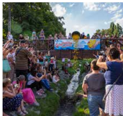
A Kacsasúztatás minden évben nagy sikert arat