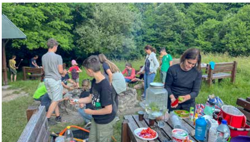
Harmincan sütögettek és zenéltek a Lajos-forráshoz a rendhagyó évbázison