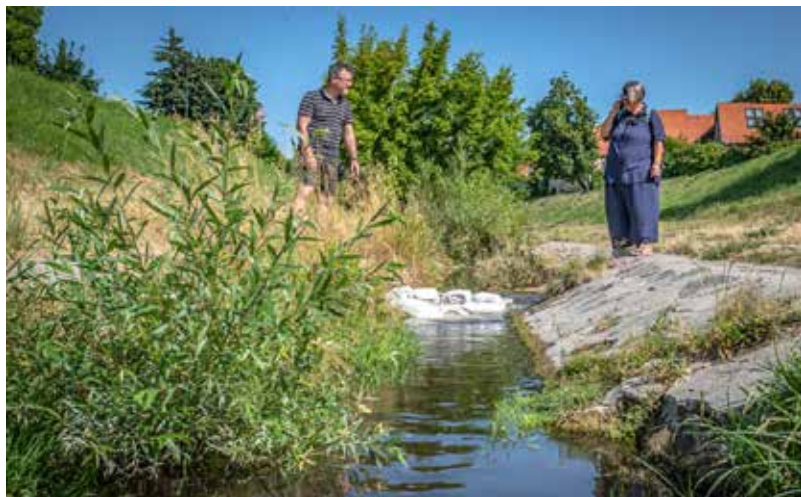
Homokzsákokkal lassítják a Bükkös-patak folyását

A kritikus mederszakaszokra előzetes megoldásként homokzsákokat helyeztek el, amelyek megtörik az egyenes lefutást, némileg fel is tartják a vizet, így részben már előre meg is mutatják,