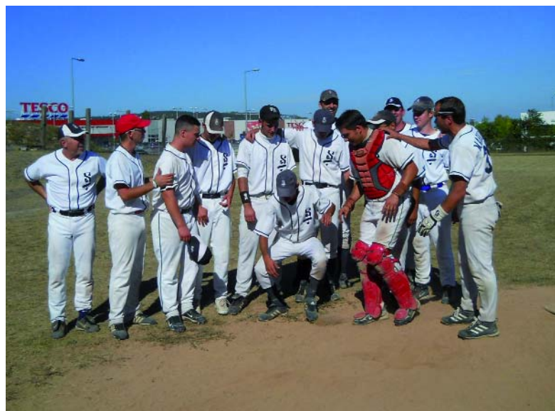
Az NB II-es bajnokcsapat

Ennyi első helyet magyar baseball klub egyszerre még nem szerzett, miután a softball csapatunk is bajnok lett két hete, illetve a magyar kupát is mi szereztük meg az augusztus végi kupadöntőn.