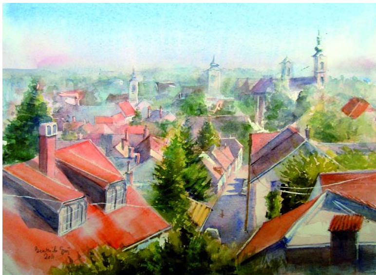
Kilátás a Szamáhegyről