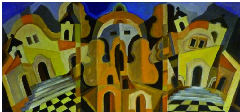
Zene és képzőművészet (murális terv, 60x130, akril, farost)

A napokban zárult Molnár Bertalan festőművész kiállítása a Vizes Nyolcas Szabadidőközpontban. Az egy hónapig nyitva tartó tárlat egyedüli és kizárólagos témája a szeretett város, Szentendre. Mint ahogy az életmű egészének is. Templomok, házak, keresztek, kapuk, tornyok, lépcsők – a városkép jellegzetes elemei jelennek meg az alkotásokon. Molnár Bertalan üde színvilágú, mozgalmas képein ezek a geometrikus motívumok gyakorta kiegészülnek a zenét idéző hegedűmotívummal. Zene és képzőművészet fonódik több képsíkban össze rajtuk.