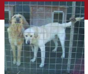
A Szabadság-forrásnál február 3-án fogták be a két labrador keverék kant