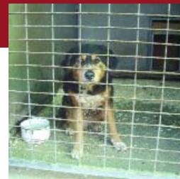
ROBI keverék kant február 19-én fogták be a Határcsárdánál