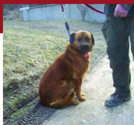
SAMU kant február 2-án fogták be a Bükkös-parton