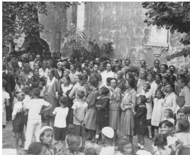
Ünneplő tömeg 1931. augusztus 19-én, a Preobrazsenszka templom udvarán

A két világháború között nyaranta a városban dolgozó festők figyelmét is felkeltette a szentendrei szerb búcsú, nem is csekély mértékben. Vajda Lajos például 1936-ban a feleségéhez Pozsonyba küldött egyik levelében az alábbiakat írta: