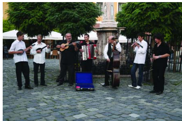
A hagyományos szerb búcsún, augusztus 19-én több helyszínen helyi és vendégzenekarok játszottak

szükségeinek ápolására, érdekvédelmére. Mindezen feladatoknak a jelenlegi intézmény messzemenően eleget tesz. Sok idős embernek az életet jelenti, hogy odajárhat, és biztonságos orvosi felügyelet mellett, kellemesen töltheti öreg napjait. Az intézményben működő Idősek Klubja munkatársai nap mint nap nagy önfeláldozásról, segítő- és szolgálatkészségről, kedvességről, és szakmai tudásról, hozzáértésről tesznek tanúbizonyságot. A Szentendre Város Gondozási Központjának dolgozói tartják a kapcsolatot orvosokkal, egyházakkal, iskolákkal, családokkal, hivatalos szervekkel. Úgy tartják egyben az egészségrendszert, hogy a város múltja, jelene és jövője is tanulhat egymástól, toleranciát, hitet, reményt, szorgalmat, megbecsülést és megértést.