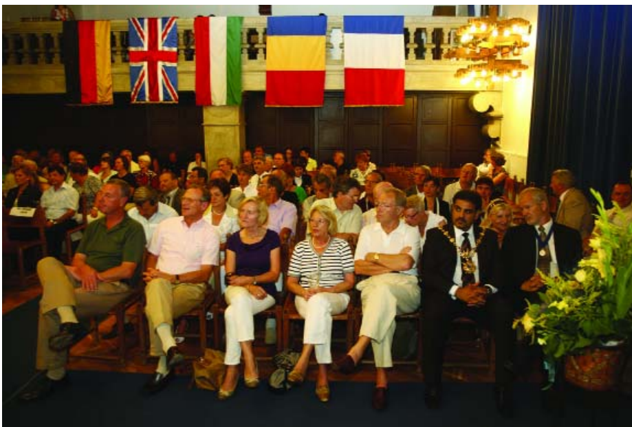
Fogadás a testvérvárosi vendégek tiszteletére a Városháza dísztermében