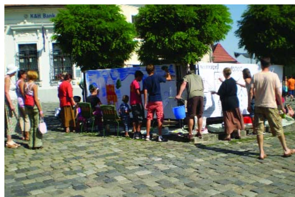
Augusztus 20., délelőtt Fő tér - Szentendrei és ide látogató gyerekek közösen festik a Szentendrei körképet