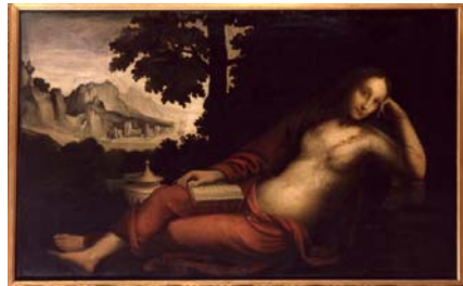
Bernardino Luini: Tájban ábrázolt Magdolna

Augusztus 30-án vasárnap pedig kedves látogatóink abban a meglepetésben részesülhetnek, hogy a kiállítás kapui megnyílnak a nagyközönség előtt és mindazok, akiknek eddig nem volt lehetőségük eljönni – INGYENESEN CSODÁLHATJÁK MEG A XIV-XV. SZÁZADI LOMBARD RENESZÁNSZ GYÖNGYSZEMEIT!