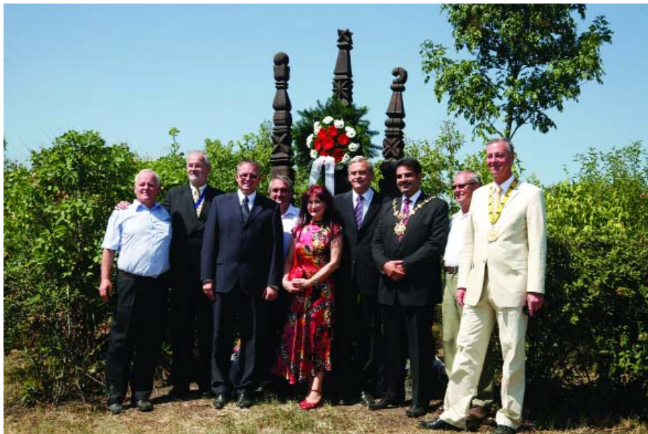
Megemlékezés az izbégi Csicserkőn a romániai forradalom emlékére állított kopjafáknál