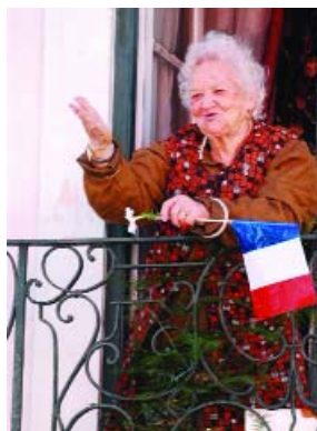
Egy díjnyertes fotó

A július 24. és augusztus 1. között megtartott EPF a XIX. Expofacis nemzetközi mezőgazdasági, kereskedelmi és ipari vásár keretében zajlott több mint tizenkétezer négyzetméteren. Ezen belül állították fel a European Village-et („európai falu”), amelyben minden ország egy-egy standdal képviselhetette magát. A mieink magyar kézműves és iparművészeti termékeket vonultattak fel, nagy sikerrel. A kezdő napon, a szombati nyitónapján okumenikus istentisztelettel vette kezdetét az egyhetes együttlét. A helyi lelkész ajándékba kapott egy magyar nyelvű, bőrkötés-