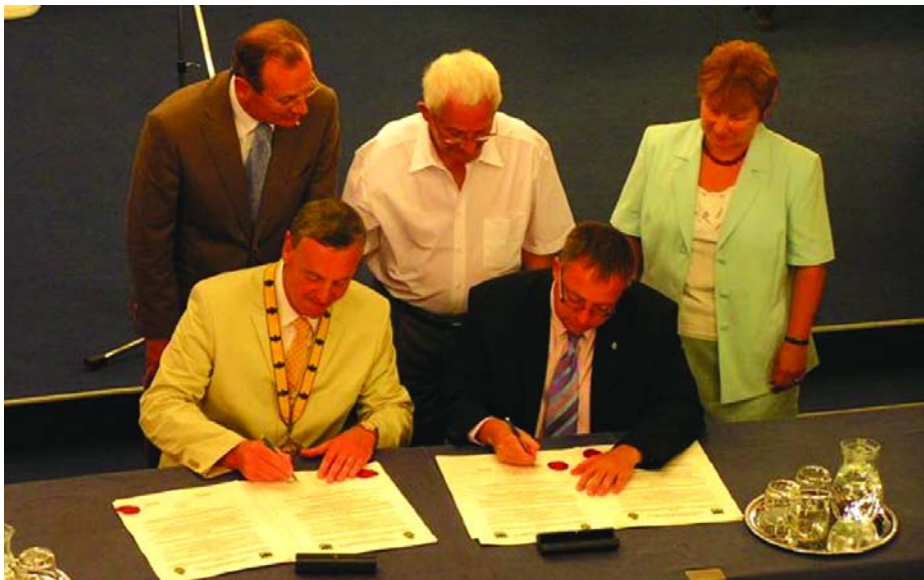
A testvérvárosi szerződés megerősítése a városok jelenlegi vezetői által a korábbi vezetők előtt.

KÖZÉLETI ÉS KULTURÁLIS HETILAP • ALAPÍTVÁ 1899-BEN MEGJELNIK PÉNTEKEN • ÁRA 158 FT XXIII. ÉVFOLYAM • 30. SZÁM • 2009. AUGUSZTUS 28.