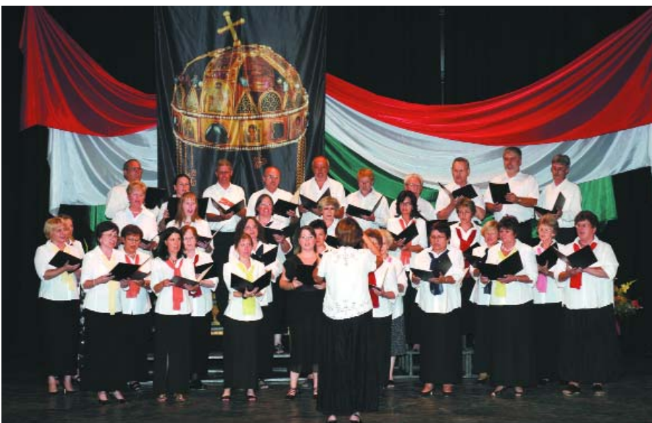
Az ünnepségen a Musica Beata kórus énekelt