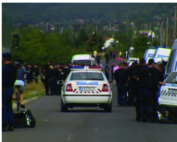
Rendőrautók sora a Sztaravodai úton a Szélkerék utcától a Skanzenig

a gárdaavatás, amit 100 ezer forint pénzbüntetéssel lehet szankcionálni. Makula György , az Országos Rendőr-főkapitányság szóvivője elmondta: a Pest Megyei Rendőr-főkapitányság egyesülési joggal való visszaélés miatt eljárást indított a gárdista-avatás egyik szervezője ellen, és összesen 176 személy ellen tett feljelentést és indított szabálysértési eljárást. Vona Gábornak , a Jobbik és a Magyar Gárda alapító elnökének gyanúsított idézést adtak át a helyszínen a rendőrök.