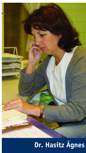
Dr. Hasitz Ágnes

Az antibiotikumok ugyanis csak komoly bakteriális fertőzések ellen hatásosak. Nem segítenek kigyógyulni olyan vírusos fertőzésekből, mint egy egyszerű megfázás vagy