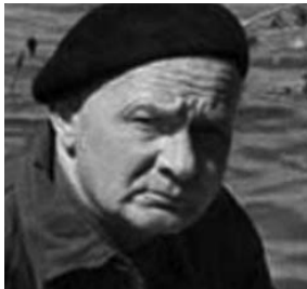
Hamvas Béla (1897-1968)