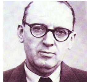
Bibó István (1911-1979)