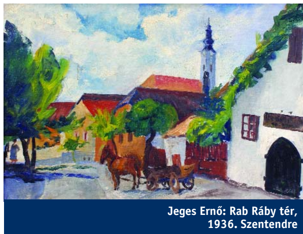
Jeges Ernő: Rab Ráby tér, 1936. Szentendre