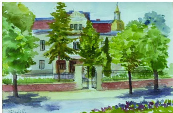
Illusztrációnk Palásthy Renáta akvarellje

A Vujicsics Tihamér Zeneiskola november 15-én, szombaton, 15 órai kezdettel emlékezik meg 100 éve született, kiemelkedő tanáiról.