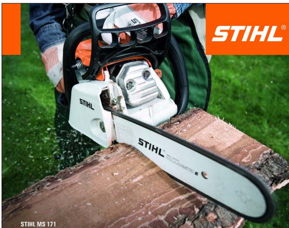
STIHL MS 171