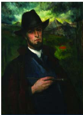
Rozgonyi László: Önarckép fekete kalapban, 1926 körül.

endrei festészetet elindító alapító mesterek emléke előtt és ugyanakkor szerves része a Szentendrei Képzőművészet Évszázada című sorozatnak, amely most a VII. részéhez érkezett. Az emlékkiállítás megtekinthető 2009. február 15-ig.