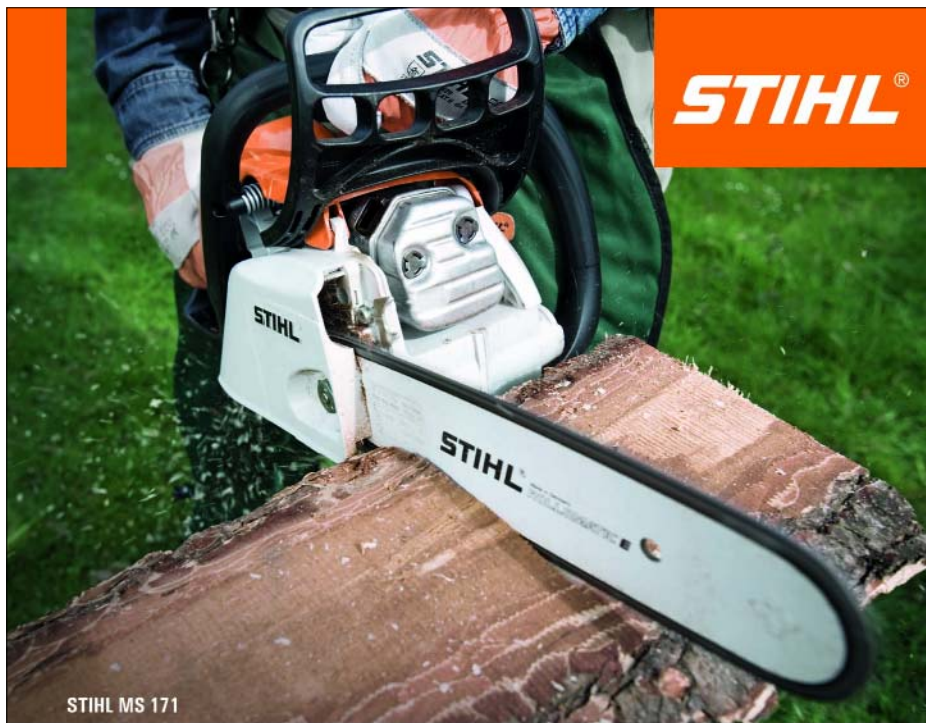
STIHL MS 171