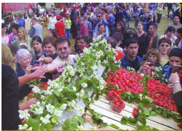
Eperfesztivál június első hétvégéjén