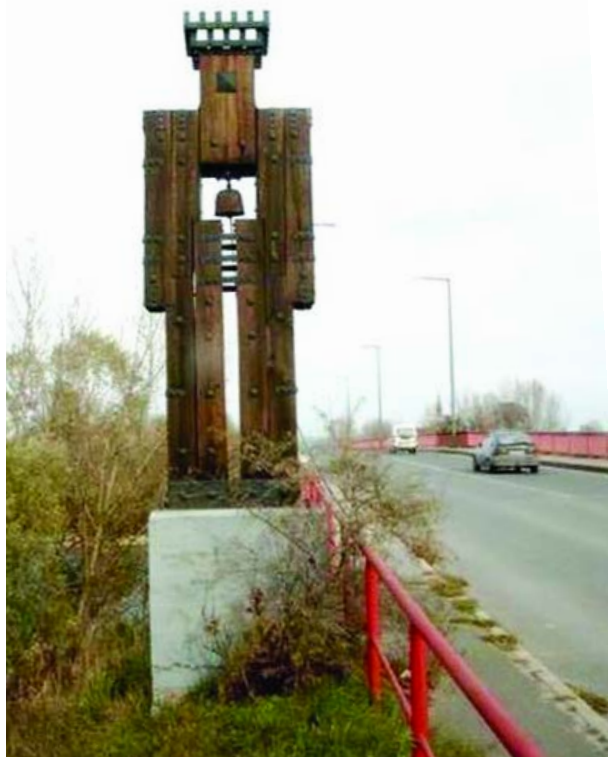
A Vadász György által tervezett óriási sakkfigurák, a Hídvigázók egyike