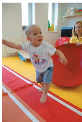
Figyelemzavar prevenció Ayres-tölcserrel

Statistikák szerint minden negyedik-ötödik gyermek, tanulási, viselkedési zavarokkal küzd. A szülők, ismerősök gyakran neveletlennek, rossznak, butának könyvelik el a másképpen viselkedő gyereket, akinek egész további életére kihat ez a megállapítás. Pedig a figyelem, olvasás, írás, számolás zavara időben észrevéve kiküszöbölhető, megelőzhető!