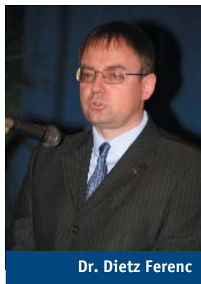
Dr. Dietz Ferenc

A közmeghallgatások, polgármesteri fogadóórák mellett tematikus lakossági fórumokat tartunk, bevezettük a városkönyvet, a zöldsámat, a zöldmailt, a „Észrevettem – szólók” ládát. Mindezek mellett nincs olyan városi rendezvény, hogy egy-két lakó el ne mondaná – néha teljesen ellentétesen – a véleményét a különböző városi ügyekről.