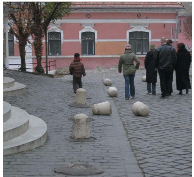
Gyakori látvány a belvárosban: az utcabútorokat, virágtartókat, padokat rendszeresen kidöntik a vandálok

a bíróságon bizonyító erejük van. Budapesten a belvárosban, illetve Esztergomban az eddigi tapasztalatok szerint a kamerák pusztán jelenléte 20-30%-kal szorította vissza a bűnözést. A képviselő-testület által január 22-én meghatározott ütemezés szerint első körben (júniusig) a Városház tér, a Templomdomb és a Fő tér kapna összesen hét kamerát. Második ütemben (júliustól decemberig) a Dumtsa Jenő utca, a Bercsényi utca és a Gomba étterem térségében szerelnének fel négy „órszemet”, 2009 elején a Bogdányi utcában, a Lázár cár téren és a Bolgár utcában folytatódna a telepítés, majd másfél év múlva a Hévíz-végállomáson, a piactéren és a Kossuth Lajos utcában is figyelniék a kamerák – ekkorra már 21 darab állna szolgálatba. (A témával jövő heti számunkban foglalkozunk részletesen.)