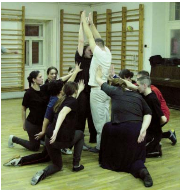
Képek a Carmina Burana próbájáról