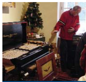
A Muzsikáló múzeumban

A Szeresd Szentendrére Séták legutóbbi, február tizediki sétája ismeretlen helyi múzeumokba invitálta az érdeklődőket. Három olyan nem régen létesült magánmúzeumba, amelyet a lelkesedés hozott létre. Mindhárom, a Lámpamúzeumot, a Muzsikáló múzeumot és a Rádiótörténeti kiállítást olyan valaki hívta életre, akinek életében az adott tárgy különleges jelentőséggel bír. Hiszen évek, évtizedek óta ezt gyűjti, szabad ideje és pénze nagy részét ennek szenteli.