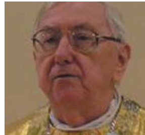
Dr. Paskai László